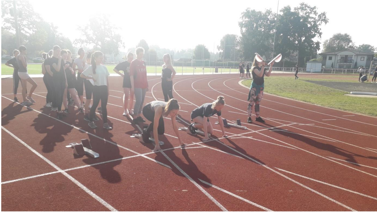
Das Wetter spielte mit, ein Hauch von Spätsommer umspielte die Athleten