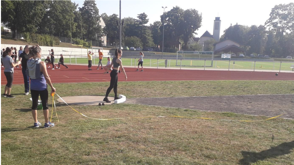
Mit dem Segen von St. Bonifatius im Hintergrund gelang der Kugelstoß exzellent