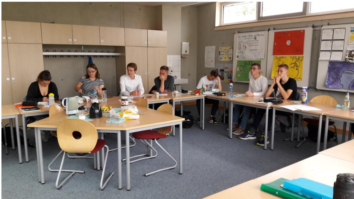
Passend zum Thema „Nero“ gab es klassische römische Speisen: Nutella und Kartoffelchips