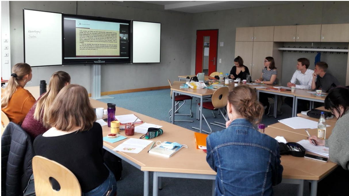
Lernen am CBG: Universitäre Vorlesung im Fach Latein