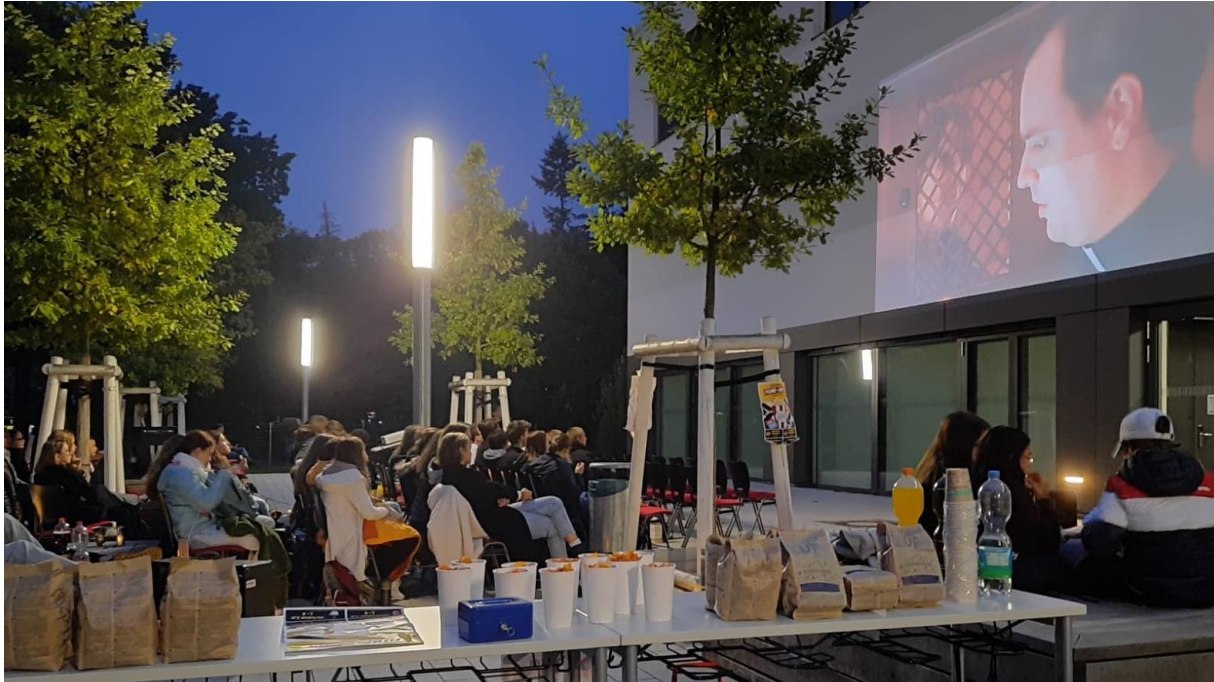
Aus der Perspektive des Caterings: der Filmabend am CBG

Am 1. Oktober startete der Film gleichzeitig mit dem Sonnenuntergang auf der als Leinwand genutzten Hauswand des Carl Bechstein Gymnasiums. Zirka 100 Schülerinnen und Schüler hatten sich um 18 Uhr versammelt, um, mit Popcorn, Nachos und anderen Leckereien ausgestattet und in warme Mäntel und Decken eingewickelt, den Film „Monsieur Claude und seine Töchter“ gemeinschaftlich zu schauen.