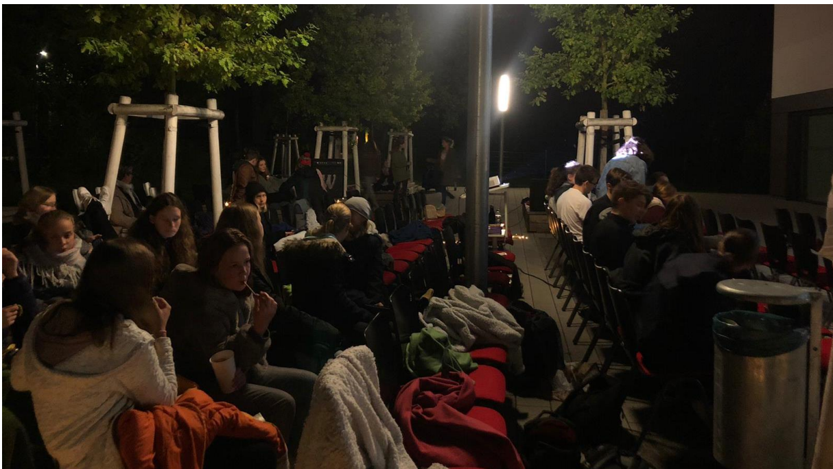
Aufgeregte Zuschauer in der Pause kurz vor dem Ende

Glücklicherweise ohne Probleme durch zum Beispiel das Wetter fand der Abend einen schönen Ausklang.