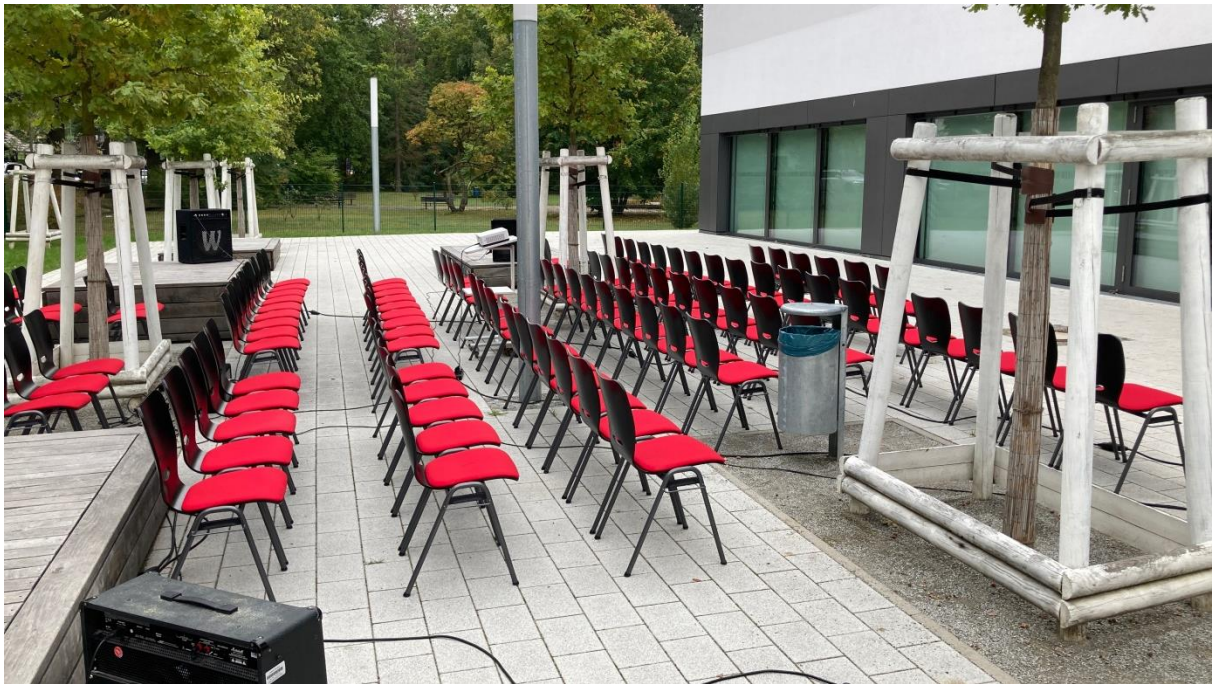
Gut vorbereitet: „Der Outdoor-Kinosaal“

Am Abend mit dem Schein des Vollmonds kamen nach und nach Schülerinnen und Schüler aus fast allen Jahrgängen unseres Gymnasiums und versammelten sich auf dem Schulhof um den Projektor. Der Geruch von frischem Popcorn, Lichterketten und Hintergrundmusik brachte alle Teilnehmer in Stimmung, noch bevor der Film überhaupt losging. Der Jahrgang 12 sorgte für die kulinarische Versorgung.